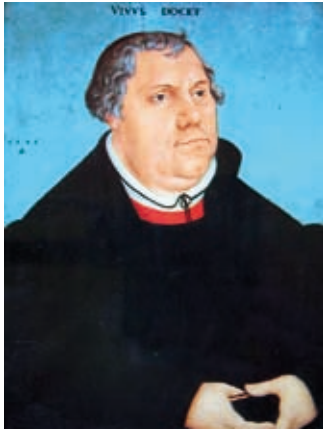
Maarten Luther (1483-1546)