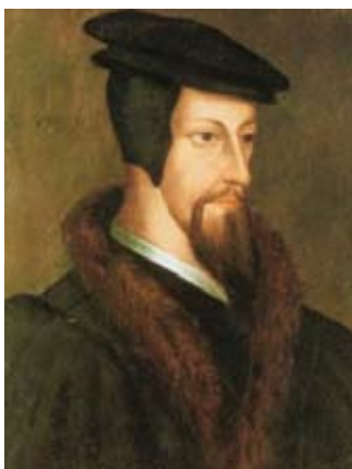
Johannes Calvijn (1509-1564)