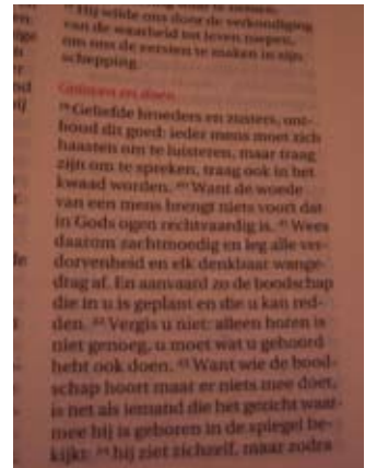
Hetzelfde stukje, maar dan uit de Bijbel in het Nederlands