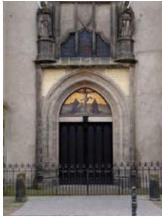
De deur van de kerk waarop Luther zijn stellingen spijkerde