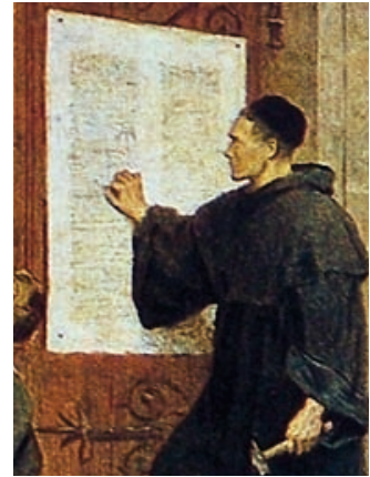
Luther laat zijn stem horen!